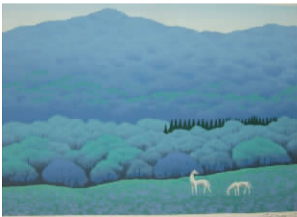
国武久已版画遗作

他将自己对事物美的独到见解与对生命意义的深刻感悟与观众分享的同时,也让观者感到了无比的幸福与宽慰,这正是他的作品很容易为人所接受的原因。