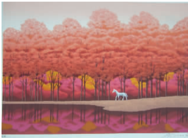
国武久已版画遗作